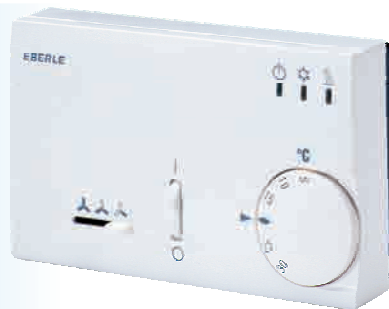
KLR-E 525.52 4p