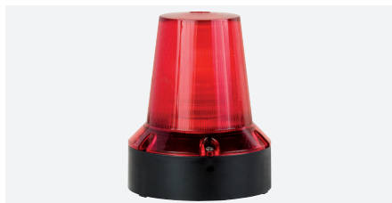
ACC SRL 12