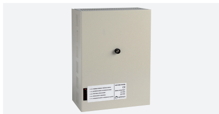
ACC SGB 12V