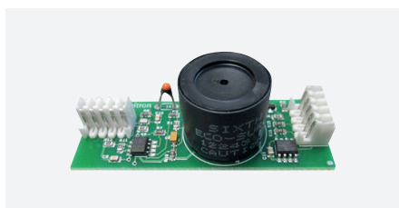
ACC RIC 0001