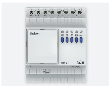
RME 4U KNX