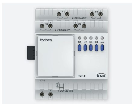
RME 4I KNX