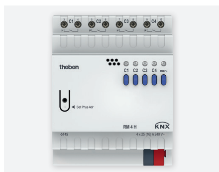
RM 4H KNX