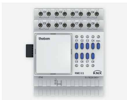
RME 8S KNX