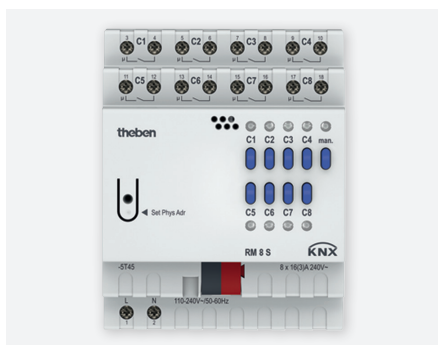
RM 8S KNX