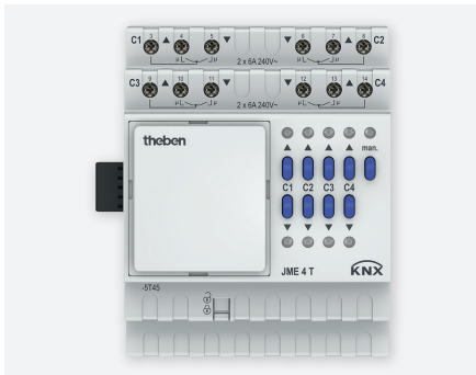
JME 4T KNX