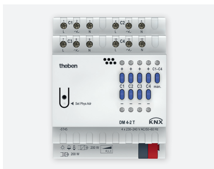
DM 4-2T KNX