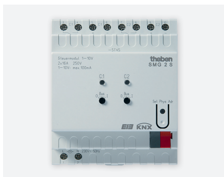
SMG 2S KNX 1-10V