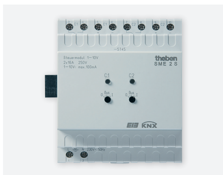
SME 2S KNX 1-10V