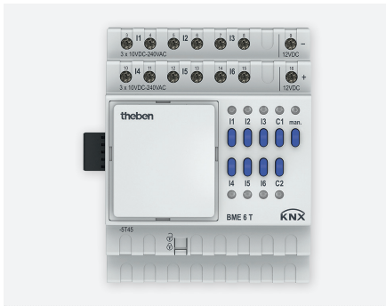
BME 6T KNX