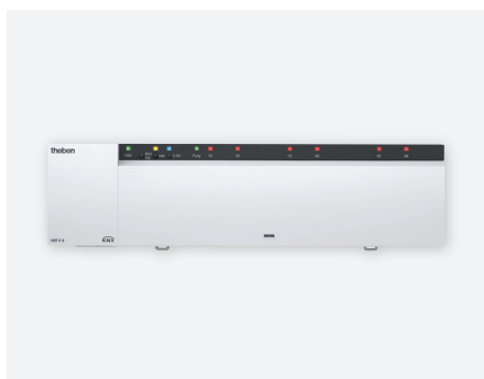
HMT 6S KNX