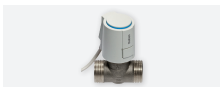
ALPHAS 24V, servomoteur - 24 V