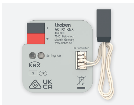
AC IR1 KNX