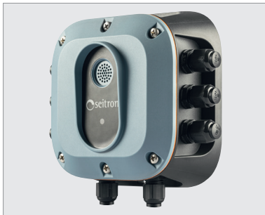
COOL GUARDIAN R454B