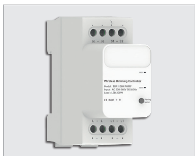
TDR1 DIM PWRF