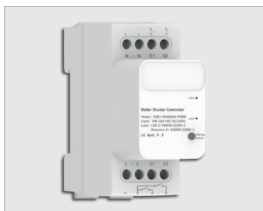
TDR1 WINDOW PWRF