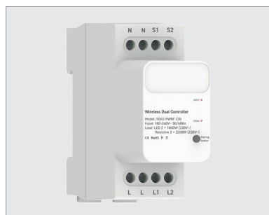
TDR2 PWRF 230