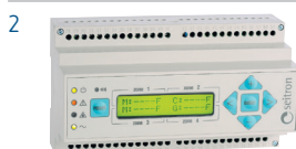
2 Centrale de détection RYM02M0