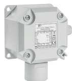
6 capteurs gaz selon le type de gaz à détecter