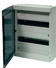
Coffret avec porte translucide