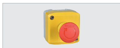
EMERGENCY STOP, bouton d'arrêt d'urgence