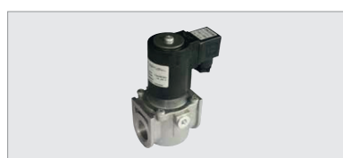
EVG 230 NCA 034, électrovanne gaz normalement fermée à réarmement automatique