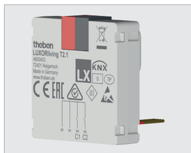
LUXORliving T2 1