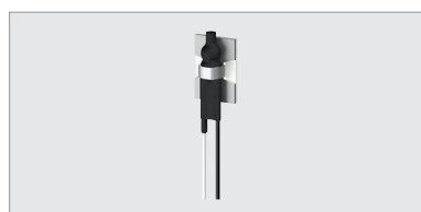
907.0.496, sonde de température encastrée