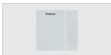
907.0.459, sonde de température IP65