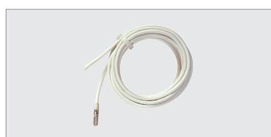
907.0.321, capteur de température sol IP65