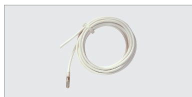
907.0.321, sensor voor vloertemperatuur IP65