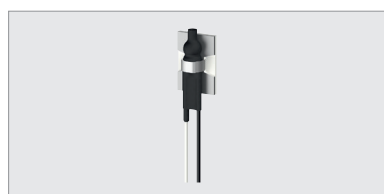
907.0.496, ingebouwde temperatuursensor