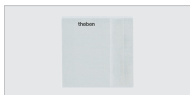
907.0.459, temperatuurvoeler IP65