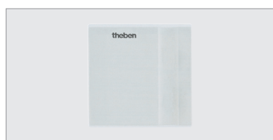
907.0.459, sonde de température IP65