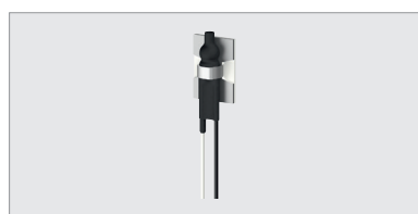
907.0.496, sonde de température encastrée