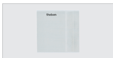
907.0.459, temperatuurvoeler IP65