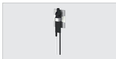
907.0.496, ingebouwde temperatuursensor