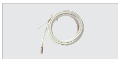
907.0.321, sensor voor vloertemperatuur IP65