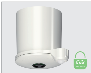
thePixa P360 KNX SET AP WH