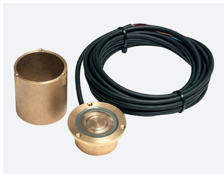
TEK-3356 1M , aansluitkabel van 1 m TEK-3356 6M , aansluitkabel van 6 m TEK-3356 20M , aansluitkabel van 20 m