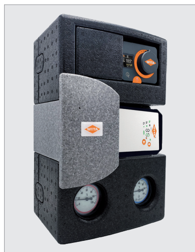
WIT GPFSC DN25